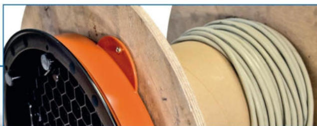
Support pour vis